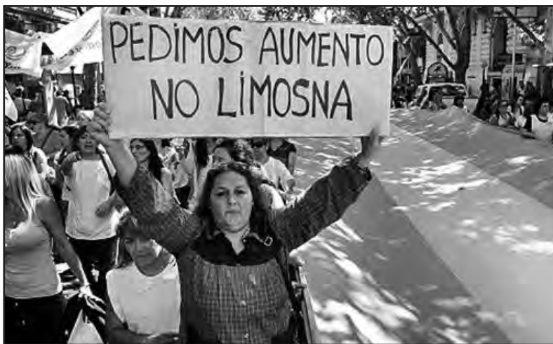
2014 fue el año en que más perdieron los salarios

La inflación en 2014 llegó al 40% y en las paritarias se lograron aumentos que solo alcanzaron el 30% en promedio, y en cuotas. Por eso los salarios perdieron gran parte de su poder de compra. En el gobierno insisten en ocultar esta realidad. El INDEK anunció una inflación de 1,1% para enero, cuando todos los analistas señalan que fue superior al 2%. Ahora, cerca del inicio del ciclo lectivo, los artículos escolares aumentaron entre el 40 y el 60%. Encima, la baja de las naftas duró menos que el verano. Y volvieron a subir. En diciembre el gobierno había anunciado con bombos y