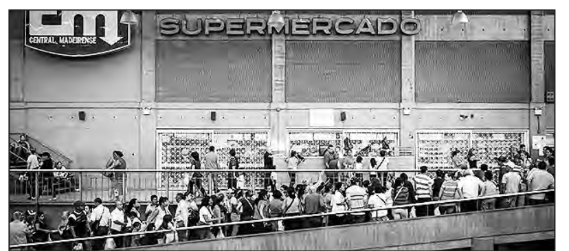
Interminables colas para conseguir alimentos

No dudamos que en medio de la grave crisis económica, social y política que vive el país, hay elementos marginales aventureros entre las fuerzas armadas y la derecha que tramen alguna aventura golpista. Sin embargo, lo público y notorio es que el gobierno viene aplicando un ajuste sobre la base de acuerdos con Fedecámaras (Cámara de empresarios) y la MUD (la alianza de los partidos de derecha) y que toda la estructura de mando de las Fuerzas Armadas responden al gobierno y tienen a cambio toda clase de privilegios y muchos participación en el festín