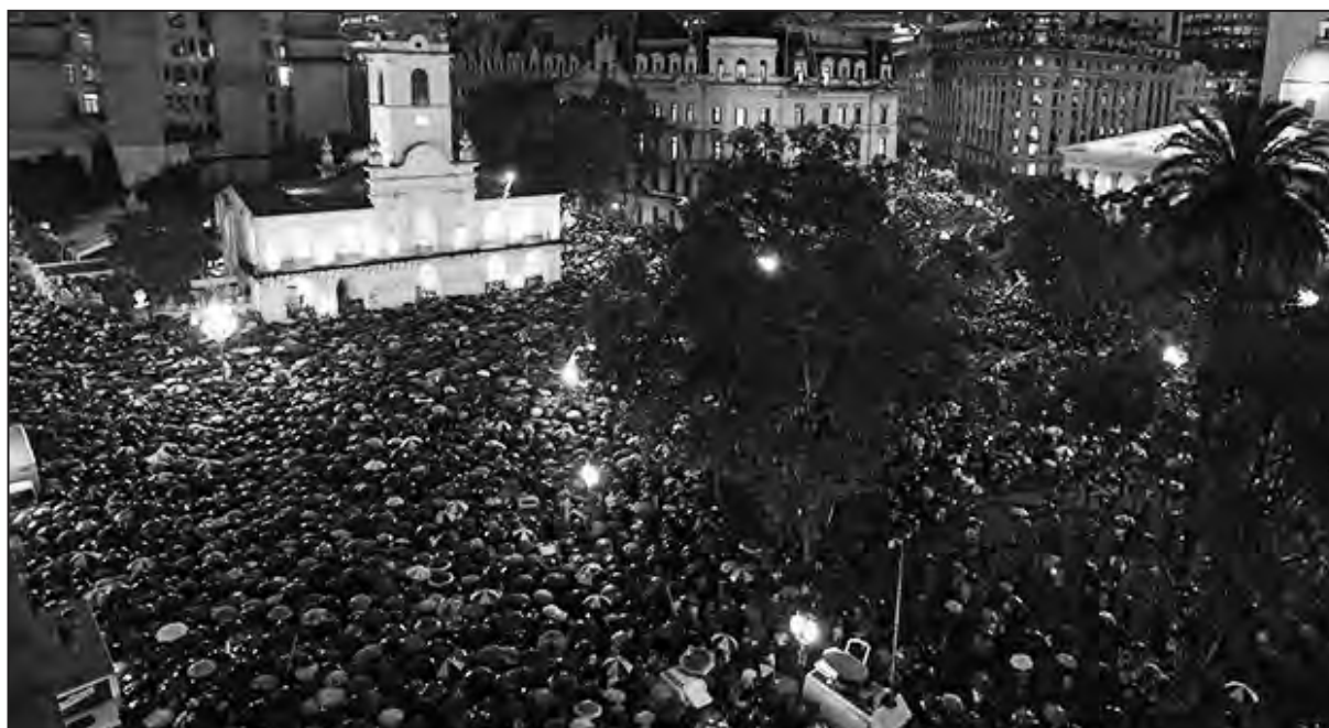
Vista de la marcha en Plaza de Mayo

Pero para lograr el esclarecimiento de la muerte de Nisman, castigar a los culpables y lograr justicia, se necesita emprender una movilización para enfrentar al aparato represivo K y por cambiar a esta justicia de raíz. Por eso Izquierda Socialista, si bien exigió desde un primer momento el esclarecimiento