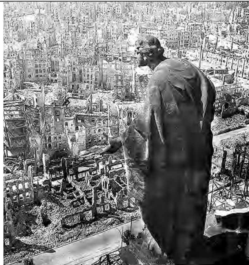
Dresde tras el bombardeo vista desde lo alto de la torre del ayuntamiento. Famosa foto de Richard Peter.

Una de las "justificaciones" de estas masacres fue la supuesta búsqueda de la desmoralización entre la población civil alemana. De todos modos, hubo voces importantes que lo denunciaron desde un principio en la propia Inglaterra. Muchos historiadores y especialistas sobre la Segunda Guerra los consideraron "moralmente condenable,